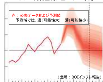
図2：先物金利に基づくCPI予測